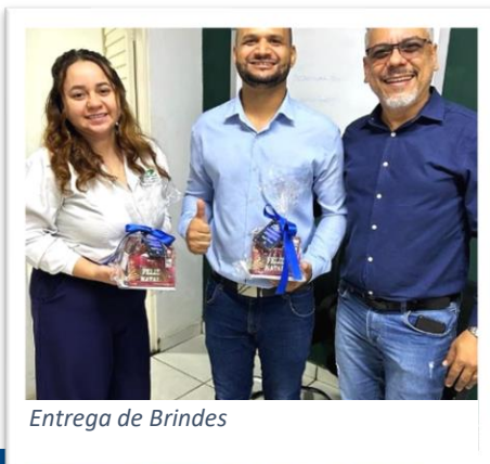
Entrega de Brindes