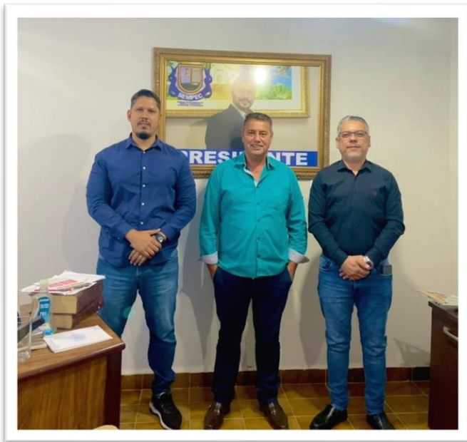
Visita SINDSCOND/MT ao SEMPEC/MT