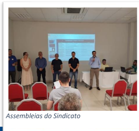
Assembleias do Sindicato