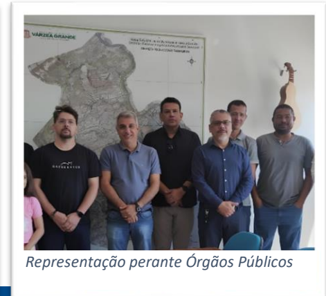
Representação perante Órgãos Públicos