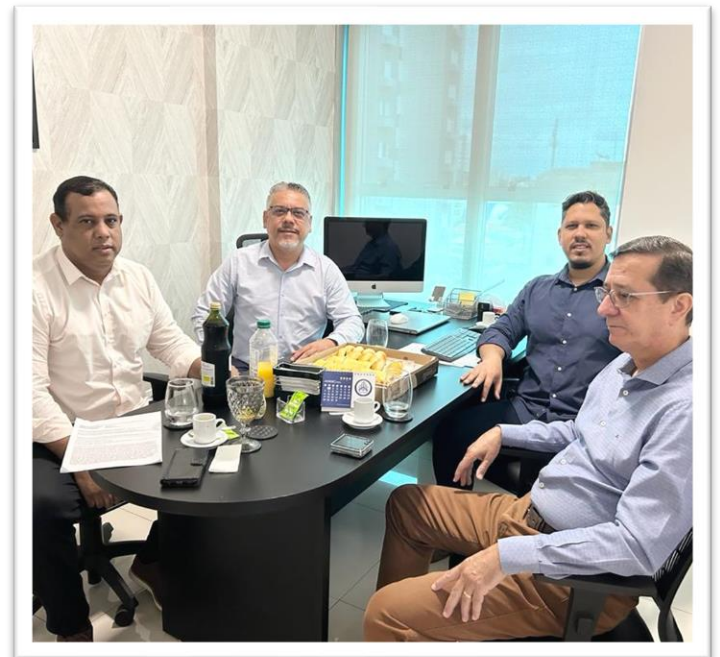
Reunião SINDSCOND/MT e SECONVAG/MT